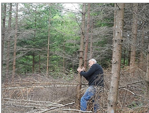
Lykožrút napáda postupne aj mladé porasty