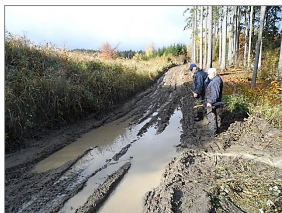
Po ťažbe sa vykonáva oprava lesných ciest