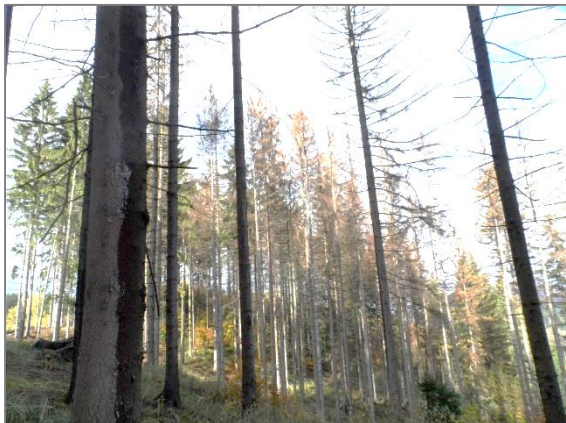
Kalamita spôsobená drevokazným hmyzom (lykožrút)