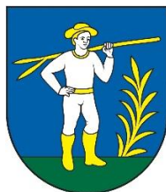
Erb mestskej časti Zádubnie